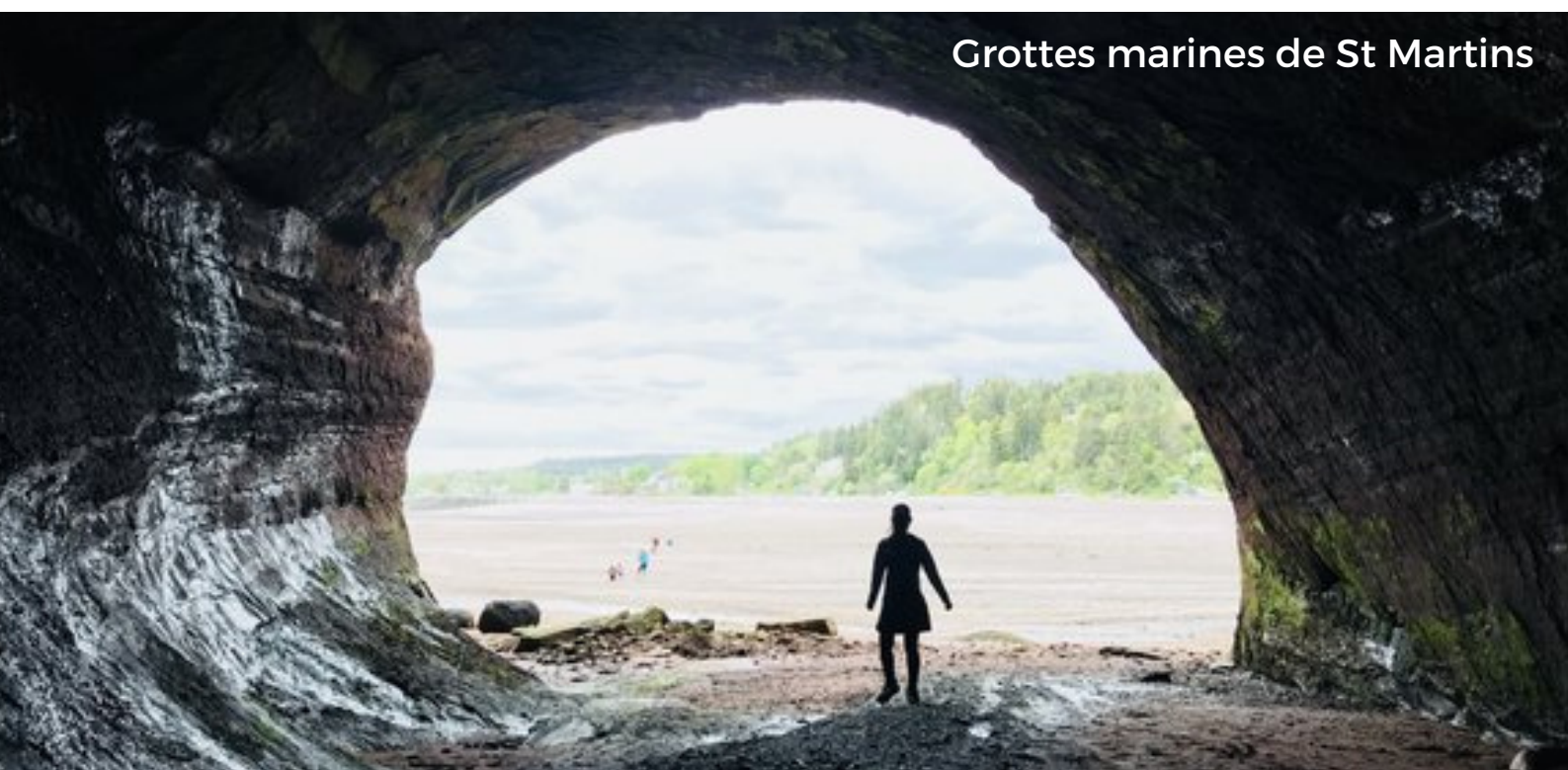
Grottes marines de St Martins

Les groupes de travail sur l'antiracisme et l'action climatique travailleront en collaboration avec les membres des groupes de travail existants de l'ACPL (groupe de travail sur les parcs et groupe de travail sur les installations et les infrastructures) pour aider à réaliser le mandat et la vision de l'ACPL.